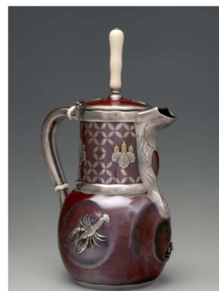
Chocolatière, Tiffany & Co, 1879, MET, New York...

Ces boissons offrent une image de prestige et de gourmandise ; leur consommation s'est matérialisée dans l'apparition d'objets qui leur étaient spécifiques comme les théières ou bien encore les chocolatières.