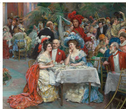
Raimundo de Madrazo y Garreta, Mascarade à l'hôtel Ritz, 1909, MET, New York, Public Domain.

On assiste à l'essor des restaurants apparus à la fin du XVIII e siècle à Paris ainsi qu'à l'apothéose des arts de la table avec notamment la prestigieuse maison Christofle.