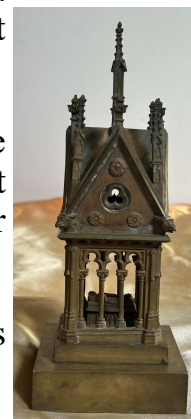
Héloïse et Abélard

Cette création nous invite à relire l'histoire de ces amants atypiques pour lesquels passion, savoir et création se mêlèrent étroitement.