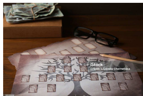
Arbre généalogique, Crayon, Branche - Partie d'une plante, Design, Histoire

L'atelier s'adresse aux débutants et vise à leur donner les clefs pour mener leurs recherches, sur internet ou en salle de lecture, de façon autonome.