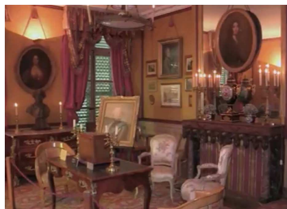
George Sand Photo collection PSK

Explorons ensemble l'héritage de cette véritable héroïne romantique, dont la vie publique privée croise celle des plus grandes figures de son temps.