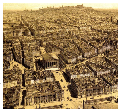
Haussmann Photo collection PSK

Explorons ces « travaux d’Hercule », à l’origine du Paris moderne.