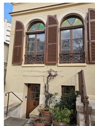
Musée Vie Romantique Photo collection PSK

Explorons la richesse de cet univers unique, des soirées à l'atelier sous Louis-Philippe à ces collections qui permettent d'évoquer aussi la très riche personnalité de George Sand... à l'occasion du 150 e anniversaire de sa mort.