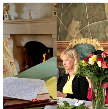
Photo de l'intervenante. Autorisation donnée pour la publication.

Comment découvrir alors, comme pour un « Chariot des quatre saisons », un éventail sucré, salé et fleuri pour tous les goûts : d'Arcimboldo à Francis Ponge nous nous régalerons en les relisant !