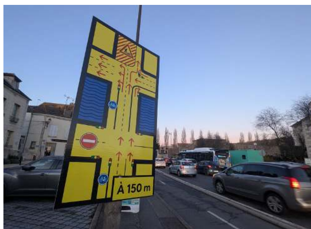
Le boulevard Gambetta va être en travaux et va impacter la circulation dans le centre-ville de Melun.

En parallèle, des interventions de nuit, programmées dès décembre, seront réalisées