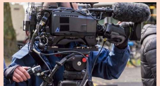
Des figurant(e)s sont recherchés pour le tournage d'une série à Melun.