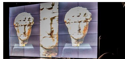
MICRO FOLIE MELUN VAL DE SEINE