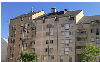
LE PLAN DE SAUVEGARDE DE LA RÉSIDENCE ESPACE