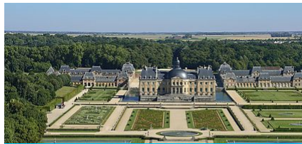
LES 9 ATOUTS DE L'AGGLOMÉRATION