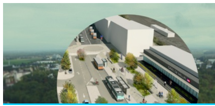
LE QUARTIER CENTRE-GARE : UN APPEL À PROJET TERTIAIRE INNOVANT