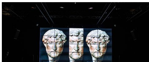
LA MICRO-FOLIE MELUN VAL DE SEINE