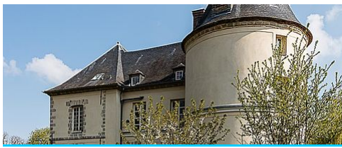
LE PLAN DE PAYSAGE