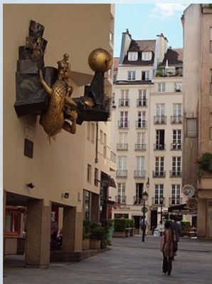
L'Horloge Le Défenseur du temps

A Paris, ville de tous les mystères, la magie et l'alchimie affleurent en permanence, pour qui sait décrypter ces histoires étonnantes et souterraines. De nombreux personnages détenteurs d'un savoir ésotérique ont séjourné dans le quartier médiéval du Marais, pour la gloire ou la disgrâce. Découvrez les secrets de l'Hôtel de Sens, l'Eglise Notre-Dame de St-Gervais, l'ancienne place de la Grève, la Tour St-Jacques, l'Horloge automates « Le défenseur du temps » et la Maison de Nicolas Flamel