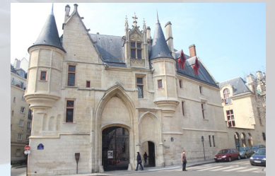
L'hôtel de Sens

Rdv à 14h15 : sortie du Métro Saint-Paul (Paris 4 ème )