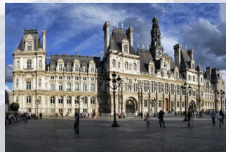
L'hôtel de ville de Paris, anciennement Place de Grève