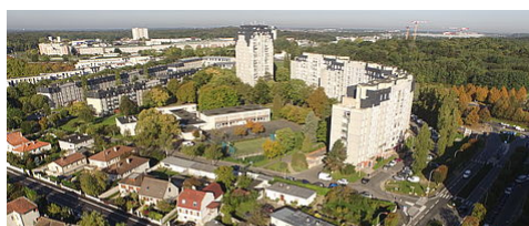
LE NOUVEAU PROGRAMME DE RENOUVELLEMENT URBAIN