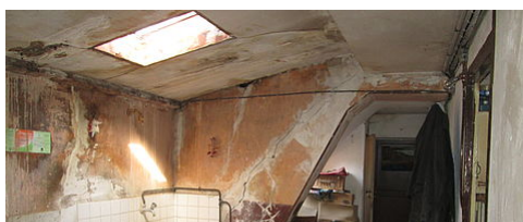
LE PERMIS DE LOUER