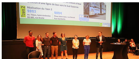
AMBITION 2030 : POINT D'ÉTAPE, 1 AN APRÈS LE LANCEMENT