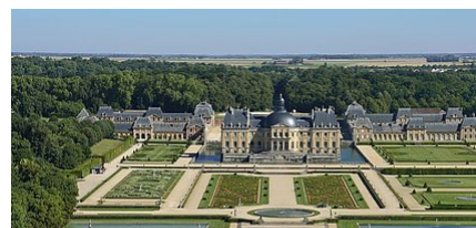
LES 9 ATOUTS DE L'AGGLOMÉRATION