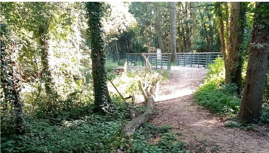
Pose de la passerelle au-dessus du ru du Bobée : cette nouvelle passerelle, installée en janvier 2023 et située à Saint-Germain-Laxis, permettra de franchir le ru du Bobée en toute sécurité tout en assurant le bon écoulement de l'eau même en cas de crue.

À terme, l'itinéraire, long de 8,9 kilomètres, reliera la place Saint-Jean de Melun à Saint-Germain-Laxis, en desservant le château de Vaux-le-Vicomte . Cet itinéraire intégrera des panneaux de jalonnement (à la gare de Melun, à Saint-Germain-Laxis...).