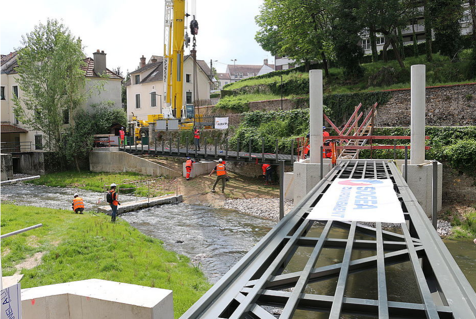
La pose de la passerelle P1 s'est effectuée le 22 mai 2023.

Les revêtements naturels (similaires aux revêtements des allées du parc du château) ont été privilégiés pour favoriser l'intégration de cette liaison douce dans son environnement.