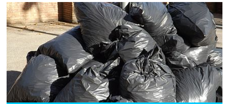
DEMANDE D'EXONÉRATION DE LA TAXE D'ENLEVEMENT DES ORDURES MÉNAGÈRES (TEOM)