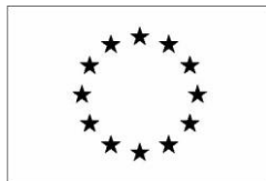
Version noir et blanc