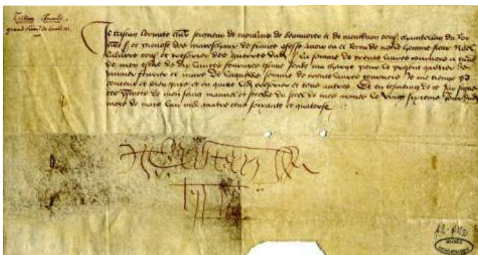
Reçu de solde de Tristan Lermite - 1474