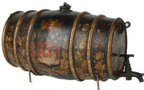
Tonnelet de cantinière – Second empire