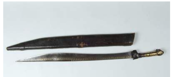
Sabre d'Abd El-Kader - 1843