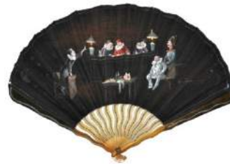
Éventail – Fin XIX e