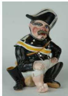
Pot à tabac – Fin XIX e