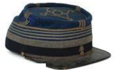
Képi - 1853